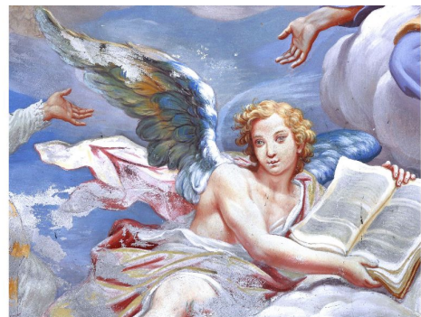
Arte e Natura: Valle Intelvi si racconta Laboratorio di storytelling sul territorio intelvese

L'Associazione Appacivi (Associazione per la Protezione del Patrimonio Artistico e Culturale della Valle Intelvi) in collaborazione con Ambarabat Aps vi invita a un ciclo di incontri pensato per conoscere meglio il territorio della Valle Intelvi e imparare a conservarlo, tramandarlo e raccontarlo. Il percorso è costituito da incontri laboratoriali tenuti dagli educatori di Ambarabat. In occasione della mostra su Giulio Quaglio, pittore di origine intelvese nativo di Laino, sperimentaremo insieme i diversi modi di raccontare la valle, con le sue ricchezze storico-artistiche e paesaggistiche: dalle chiese che sono piccoli gioielli nascosti all'arboreto monumentale. L'iniziativa si svolge all'interno il Progetto Interreg MARKS "Progetto integrato d'area per la valorizzazione del territorio transfrontaliero, storia-cultura-paesaggio".